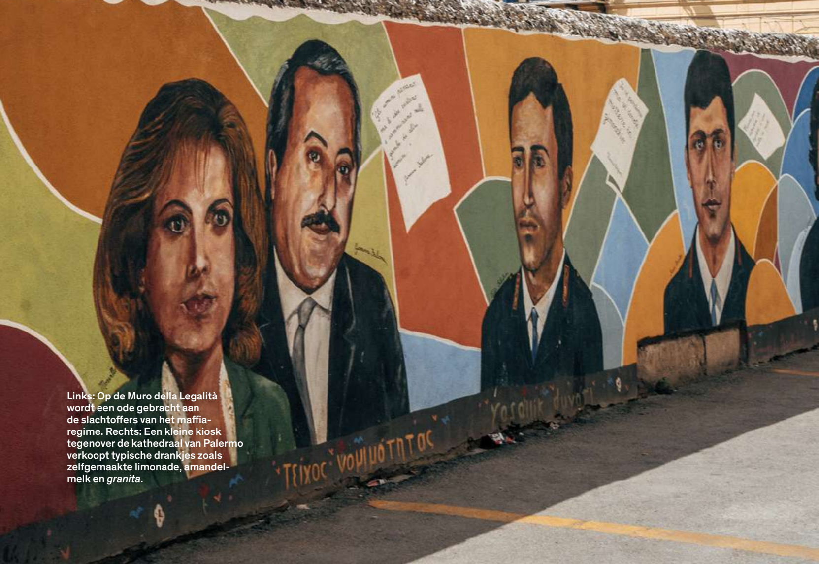
Links: Op de Muro della Legalità wordt een ode gebracht aan de slachtoffers van het mafia-regime. Rechts: Een kleine kiosk tegenover de kathedraal van Palermo verkoopt typische drankjes zoals zelfgemaakte limonade, amandelmelk en granita .